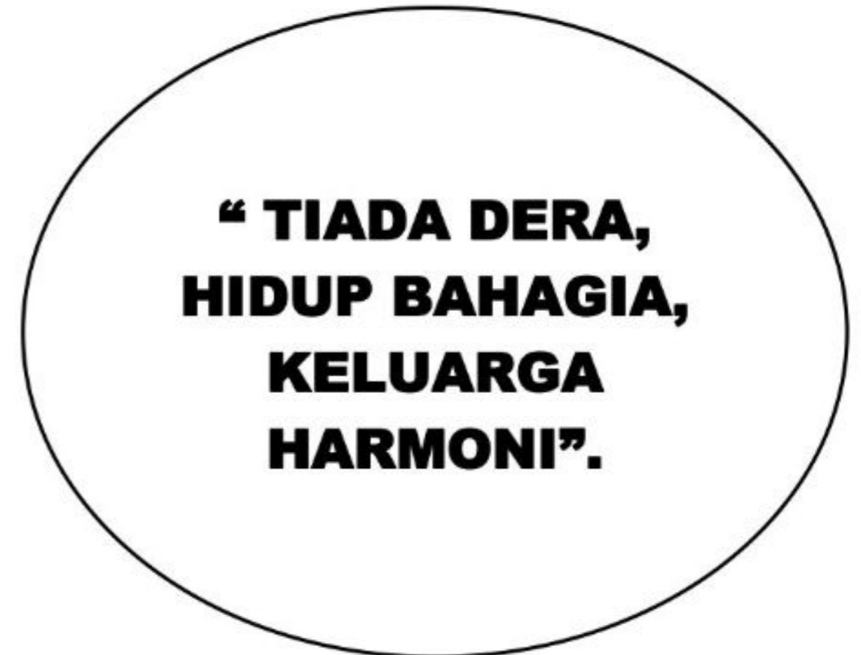
Maklumat 1: Statistik penderaan kanak-kanak