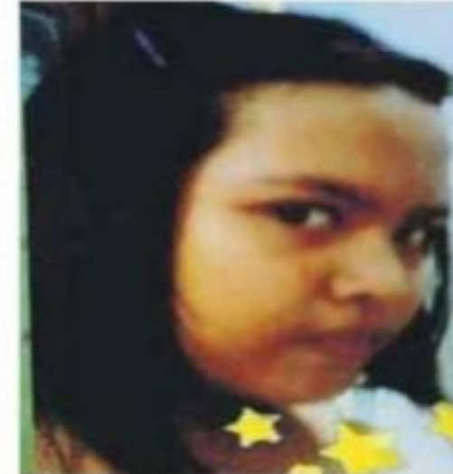
MIMI...dipercayai turut hilang

lumkan hendak keluar awal ke sekolah kerana ingin mengikuti program kokurikulum. "Tanpa mengesyaki sebarang perkara buruk, mangsa diberikan wang saku RM10 sebagai belanja makan," katanya.